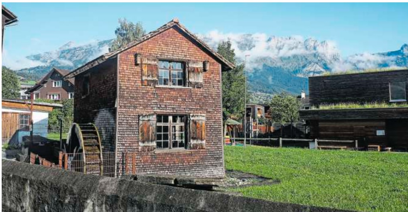
Beeindruckende Gewerbebauten in spektakulärer Kulisse am Grabser Mühlbach.